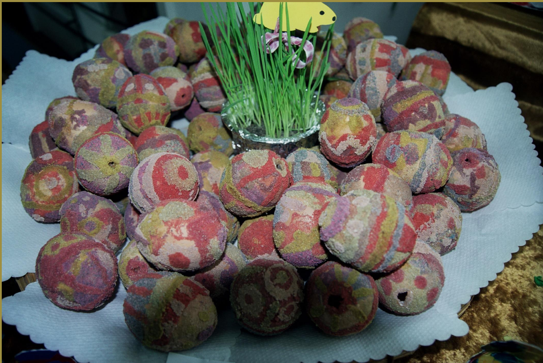
Pisanki - piasek