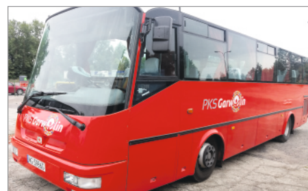
Na zakup nowych autobusów PKS Garwolin wydał 241 tys. zł