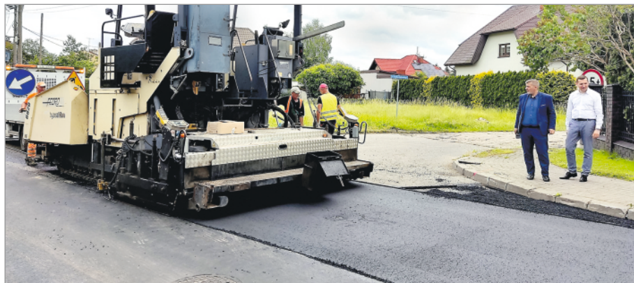
Remont ul. 3 Maja w Garwolinie

Z własnych funduszy realizowane są prace na drodze powiatowej w miejscowości