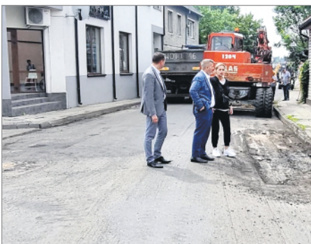
Remont ul. Henryka Sienkiewicza w Garwolinie