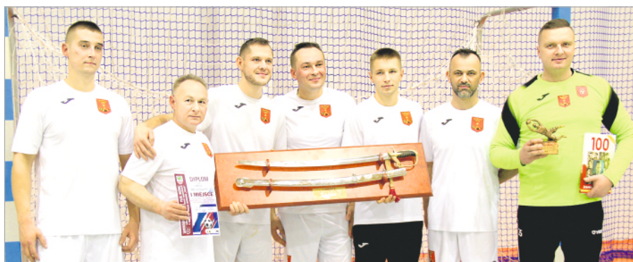
Zwycięska drużyna z Maciejowic z turniejowym trofeum