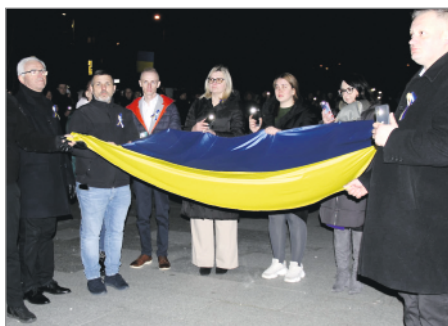
Wiec poparcia dla Ukrainy pod garwolińskim Starostwem