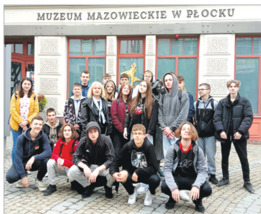
Wyjazd uczniów ZS im. Stanisława Staszica w Miętnem