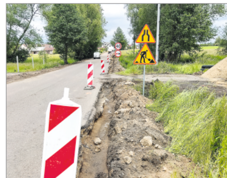
Remont w Czyszkówku

Szczególne podziękowania kierujemy do Pani Marszałek Marii Koc za wsparcie i pomoc przy pozyskaniu środków na realizację inwestycji drogowych oraz innych zadań.