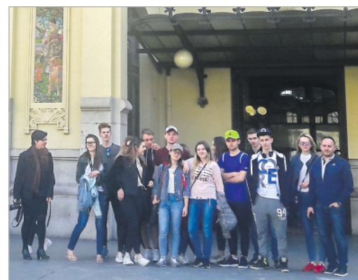
Uczniowie ZS nr 1 im. Bohaterów Westerplatte w Garwolinie ma praktykach w Walencji