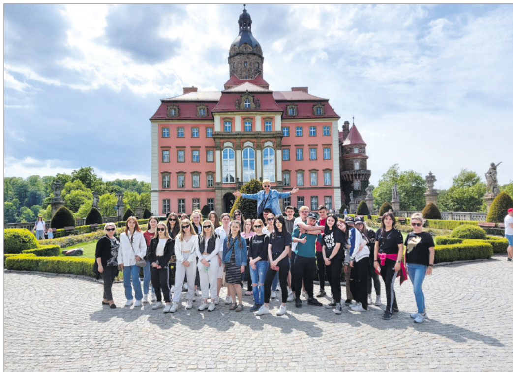
LO Żelechów na wycieczce w ramach programu #PoznajPolskę2022

Dzięki temu dofinansowaniu uczniowie z naszych szkół mogli zwiedzić m.in. Gdańsk, Malbork, Lublin, Łańcut, Opatów, Kazimierz Dolny, Kozłówkę, Wałbrzych, Wrocław, Kraków, Toruń, Poznań, Gniezno oraz Zamość.