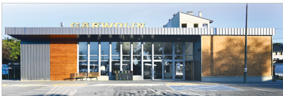
Modernizacja budynku dworca autobusowego kosztowała ponad 420 tys. zł