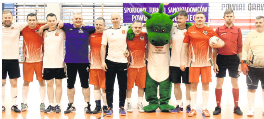
Reprezentacja Starostwa Powiatowego i Miasta Garwolina