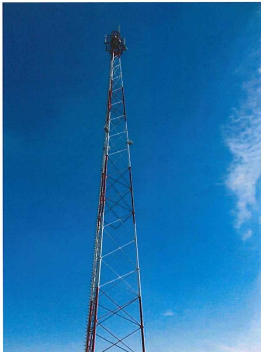
Zal. nr 1: Widok ogólny instalacji radiokomunikacyjnej.

Koniec sprawozdania. Sprawozdanie zawiera dodatkowo załączniki nr 1 i 2.