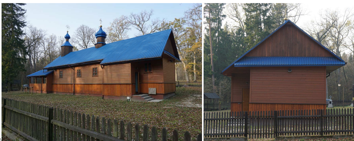
Widok ogólny od strony południowo-wschodniej i wschodniej