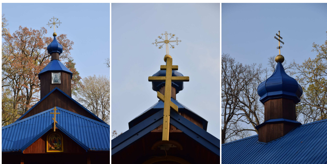
Widok na wieżę dzwonnicy zwieńczoną sygnaturką i sygnaturkę nad nawą główną. Widoczne wyraźne przechylenie krzyża na sygnaturce.