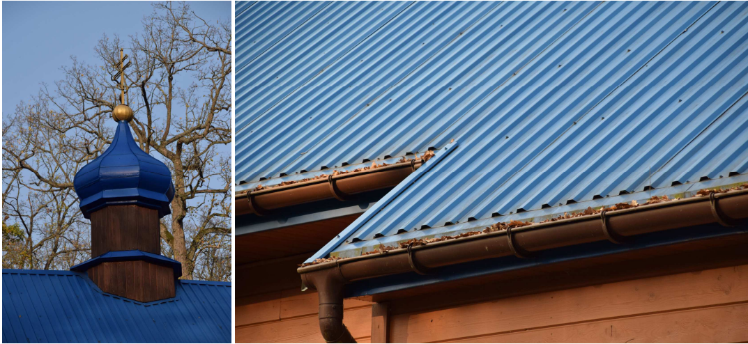
Widok pokrycia dachowego z blachy trapezowej. Widoczne początki korozji blachy