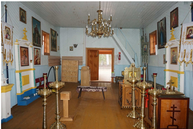
Widok ogólny na główne wejście do cerkwi