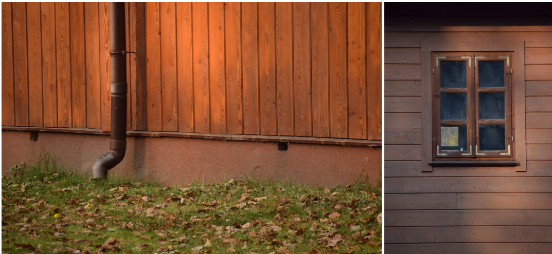
Otwory wentylacyjne podmurówki bez zabezpieczenia oraz widok stolarki okiennej