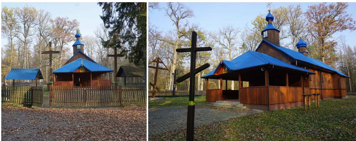
Widok ogólny od strony zachodniej i południowo-zachodniej