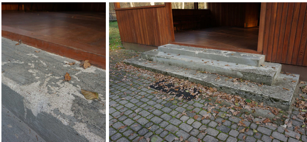
Schody przy wejściu głównym - betonowe, z ubytkami