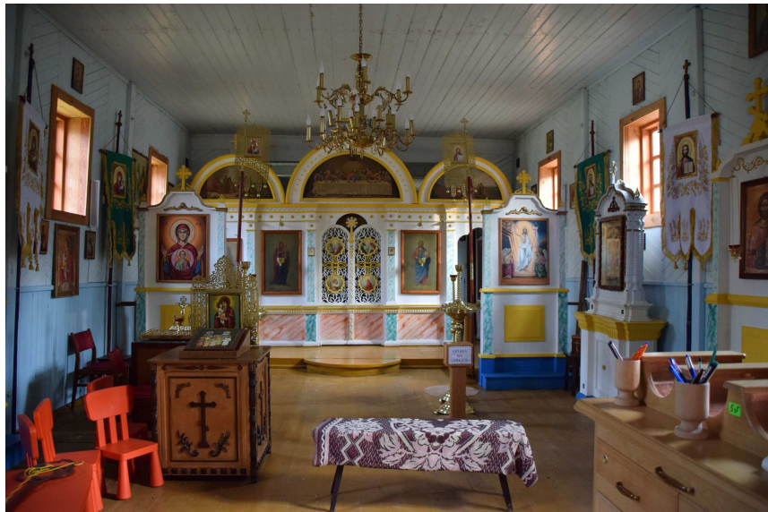
Widok ogólny od strony wejścia na ikonostas