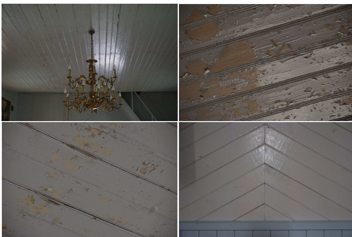
Szalówka sklepienia ścian. Widoczne znaczne łuszczenie się szalówek pokrytych farbami olejnymi.