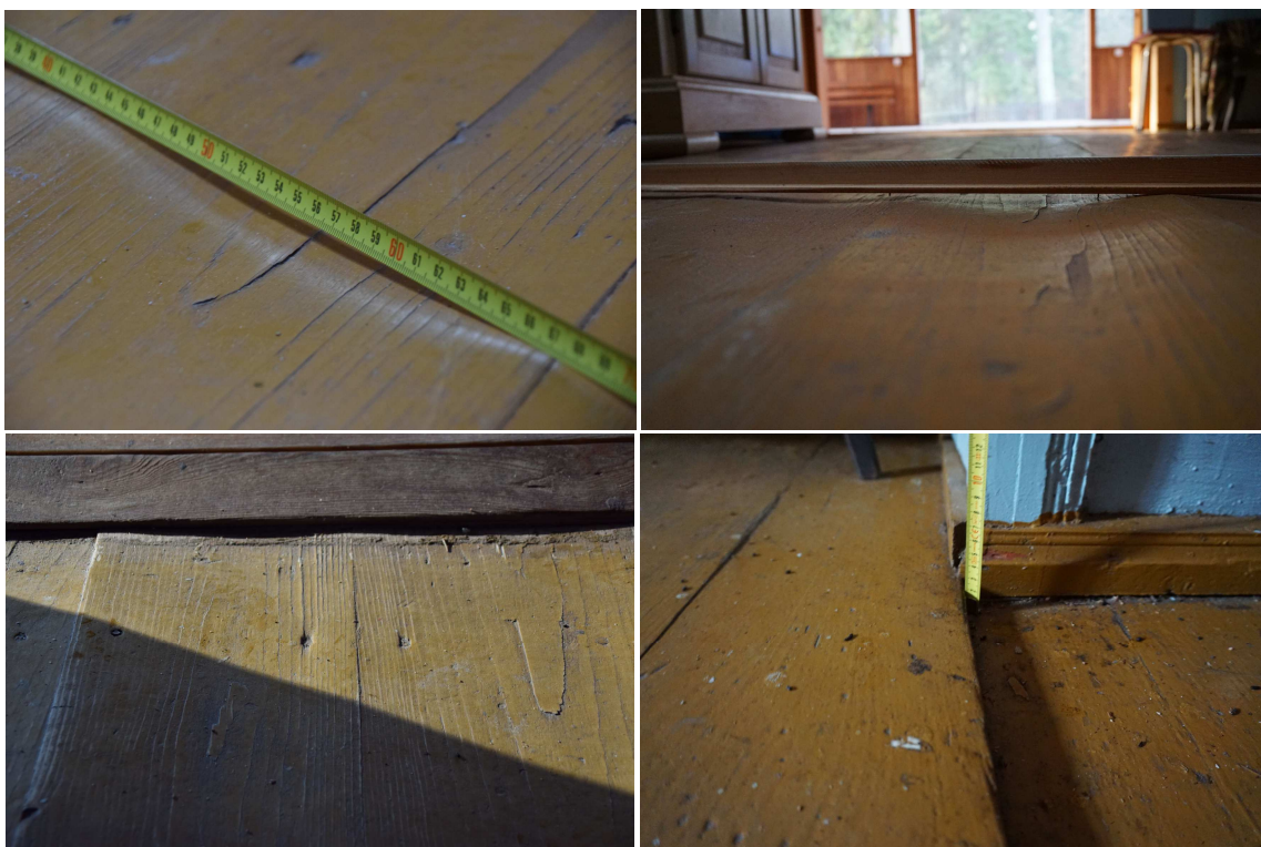
Podłoga - widocznie powyginane deski podłogowe oraz uskoki w podłodze