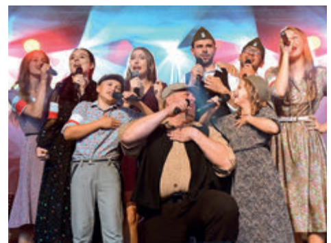
► Koncert Godzina W