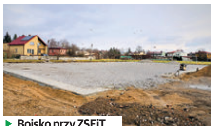
► Boisko przy ZSEiT

Nowe obiekty sportowe powstają przy Szkole Podstawowej nr 7, Zespole Wychowania i Pomocy Psychologiczno-Pedagogicznej nr 1 oraz w Zespole Szkół Energetycznych i Transportowych. To obiekty wielofunkcyjne, na których będzie można uprawiać szereg dyscyplin: piłkę nożną, koszykówkę, piłkę ręczną, tenis ziemny i siatkówkę. Warto do-