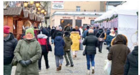
► Jarmark Bożonarodzeniowy