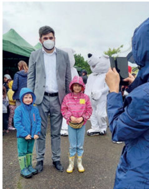
► Piknik Edukacyjny z okazji Dnia Dziecka