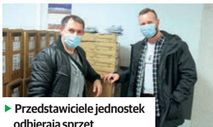
► Przedstawiciele jednostek odbierają sprzęt