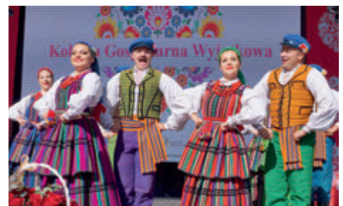
► Gala finałowa konkursu Kobieta Gospodarna Kobieta Wyjątkowa