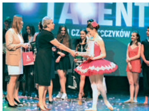
► Mam Talent u Czarniecczyków