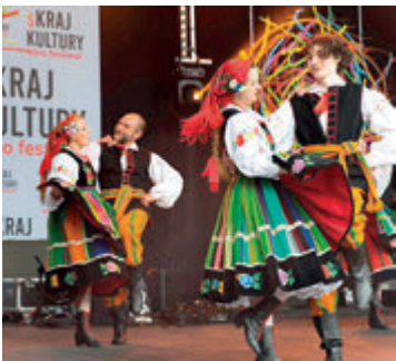
► Skraj Kultury - Etno Festival