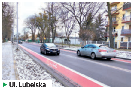
► Ul. Lubelska