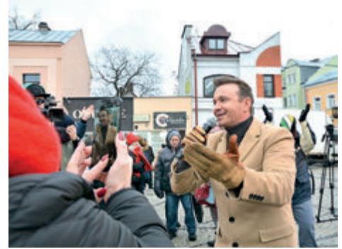
► Akcja Gramy z Gestem