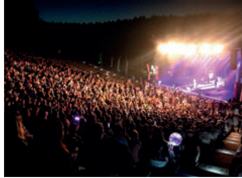
► Dni Chełma 2021