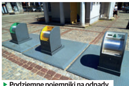
► Podziemne pojemniki na odpady

- Gniazda podziemne zlokalizowane zostaną docelowo w centrum i jego okolicach, w miejscach regularnie uczęszczanych przez mieszkańców i przyjezdnych – tłumaczy Elżbieta Fornal , kierownik Wydziału Gospodarki Odpadami Komunalnymi De-