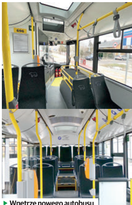
► Wnętrze nowego autobusu

- Nowe autobusy są znacznie bardziej komfortowe i oczywiście bardziej nowoczesne od pojazdów, które do tej pory znajdowały się na wyposażeniu Spółki. Zostały wyposażone w systemy zarządzania flotą oraz dynamicznej informacji pasażerskiej, klimatyzację czy porty USB do ładowania