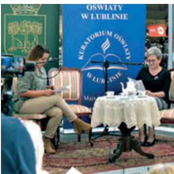
► Narodowe Czytanie