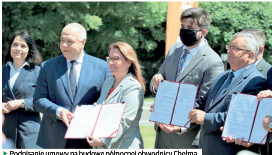
► Podpisanie umowy na budowę północnej obwodnicy Chełma

Obwodnica Chełma będzie miała ok. 14 km i będzie przebiegać po nowym śladzie. W ramach inwestycji powstanie dwujezdniowa droga z dwoma pasami ruchu w obu kierunkach. Wybudowane zostaną cztery węzły drogowe, wiadukty, dwa mosty w ciągu drogi ekspresowej i przejścia dla zwierząt