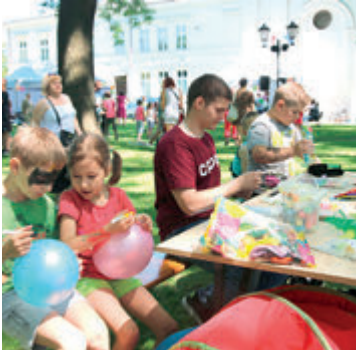
► Piknik Rodziny MOPR