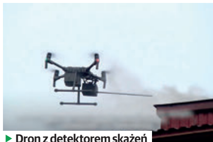
► Dron z detektorem skażeń

- Dodatkowo zrealizowano również ok. 100 kontroli przy użyciu drona z detekto-