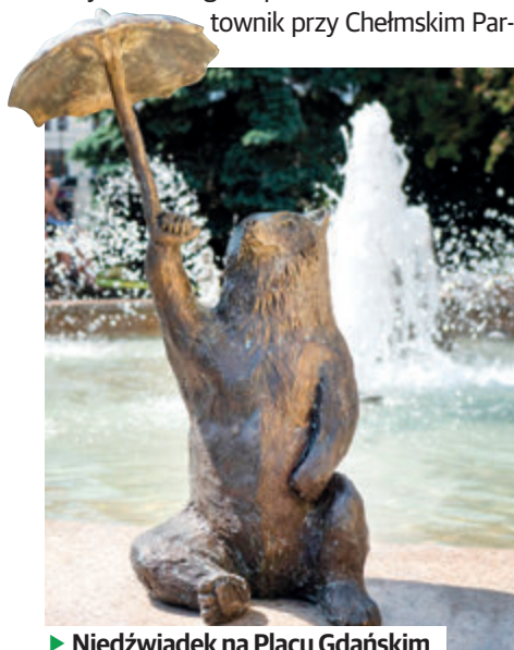
► Niedźwiadek na Placu Gdańskim