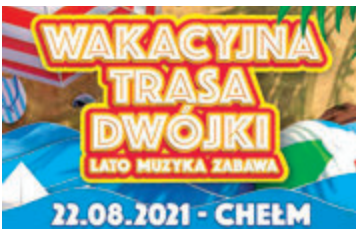
► Wakacyjna Trasa Dwójki 2021