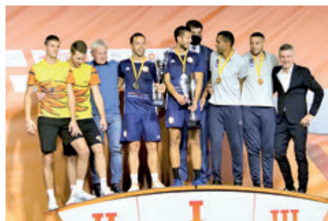
► Turniej Teqball w Chełmie