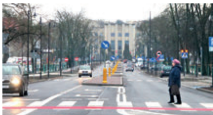
► Al. Marszałka Józefa Piłsudskiego