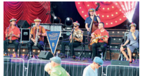
► Retro Fest - Festiwal Muzyki Rozrywkowej Dwudziestolecia Międzywojennego