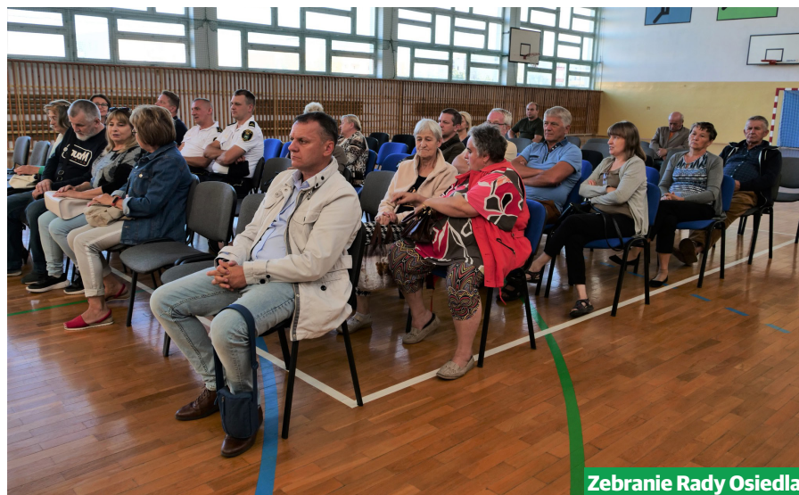
Zebrań Rady Osiedla