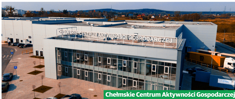
Chełmskie Centrum Aktywności Gospodarczej

Chełmskie Centrum Aktywności Gospodarczej (ChCAG) przy ul. Ceramicznej działa i tętni życiem. W obiekcie lokują się kolejne firmy.