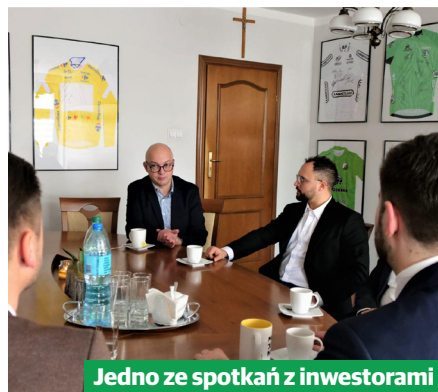
Jedno ze spotkań z inwestorami

W Laboratorium, sektor publiczny, nauki i biznesu będzie rozwijał innowacyjne technologie, takie jak m.in. inteligentny transport. Wśród zainteresowanych współpracą są już: Lenovo Poland, Hikvision Poland, PTV Group, Smart Factor oraz A-STER . – Cały czas toczą się rozmowy na temat rozpoczęcia dzia-