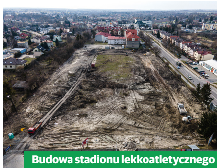
Budowa stadionu lekkoatletycznego

Urząd Miasta ogłosił postępowania przetargowe na wyłonienie wykonawcy, który zrewitalizuje Park Międzyosiedlowy. W ramach tego samego zadania przebudowana zostanie także ul. Połaniecka oraz znajdujący się w jej obrębie parking. Dodatkowo, planowane jest opracowanie dokumentacji projektowej na rewitalizację miejskiego deptaka.