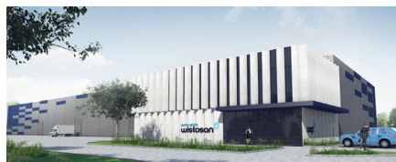
Wizualizacja terminala intermodalnego

mem funkcjonalno-użytkowym dla drogowej inwestycji. To kompleksowe opracowanie opisujące zamówienie, którego przedmiotem jest zaprojektowanie i wykonanie robót budowlanych.