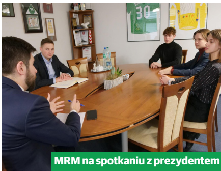
MRM na spotkaniu z prezydentem

Już na otwarciu kadencji, przedstawiciele Prezydium spotkali się z prezyden-