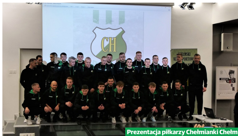
Prezentacja piłkarzy Chełmianki Chełm