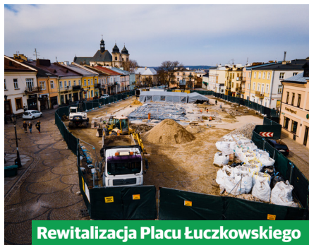
Rewitalizacja Placu Łuczowskiego

W minionym roku w Chełmie zainicjowanych zostało wiele zadań inwestycyjnych. Część z nich zakończono, a inne znajdują się w trakcie realizacji.