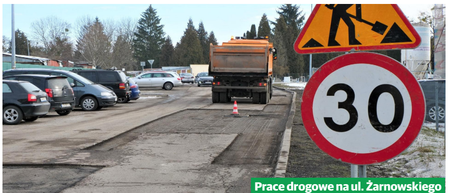
Prace drogowe na ul. Żarnowskiego

Dąbrówki, Jana III Sobieskiego, Żółkiewskiego, Królowej Jadwigi, Piramowicza, Kwiatowa, Lipowa, Plater, Traugutta, Reytana, Wybickiego, Lotnicza, Grotgtera, Ks. Skorupki, Droga Męczenników, Powstańców Warszawy, Połaniecka, Bema, Langiewicza, Nadtorowa, Baczyńskiego, Sucharskiego oraz Sowińskiego.