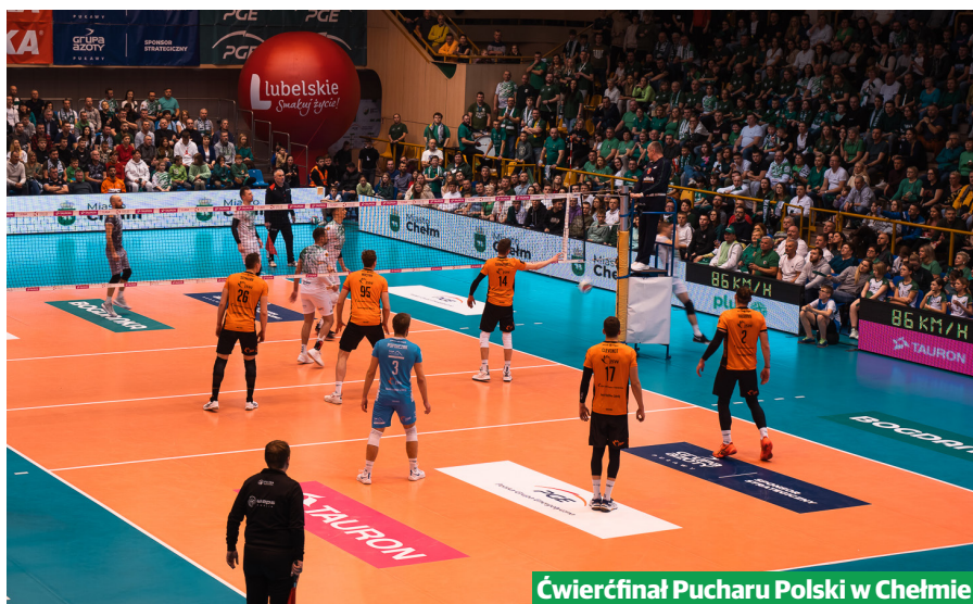
Ćwierćfinał Pucharu Polski w Chełmie

Arka Chełm, czyli chełmska drużyna siatkówki, awansowała do ćwierćfinału Pucharu Polski i dominuje w rozgrywkach ligowych. Piłkarze Chełmianki Chełm zainaugurowali sezon prezentacją i spotkaniem z kibicami.