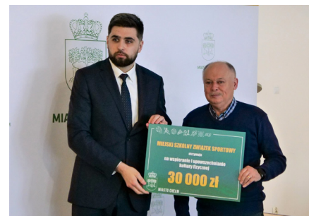
Wsparcie finansowe dla klubów i stowarzyszeń

Dodatkowe wsparcie finansowe od miasta otrzymały kluby i stowarzyszenia sportowe. W marcu 2023 roku rozstrzygnięto konkurs w zakresie wspierania i upowszechniania kultury fizycznej. Pośród 19 podmiotów rozdzielono kwotę opiewającą na niemal pół miliona złotych .