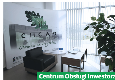
Centrum Obsługi Inwestora