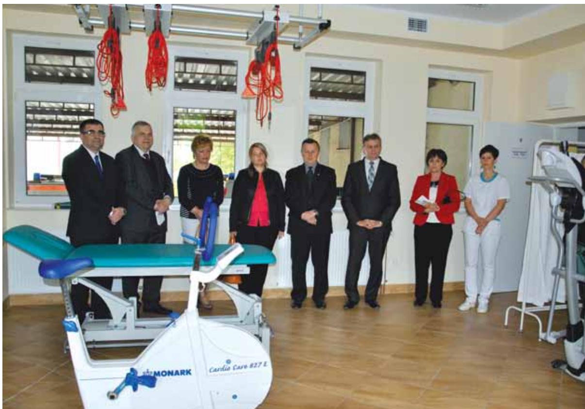
Otwarcie oddziału Rehabilitacji w Szpitalu Powiatowym w Zambrowie po remoncie