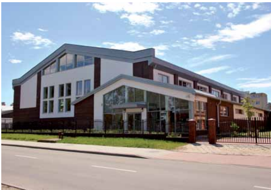
Sala Sportowa przy Zespole Szkół Nr 1 w Zambrowie