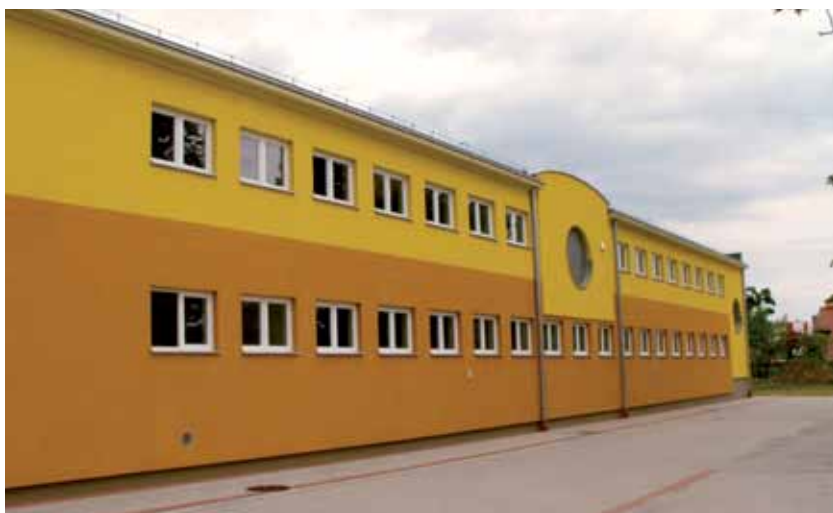
Sala sportowa przy Zespole Szkół Ogólnokształcących w Zambrowie