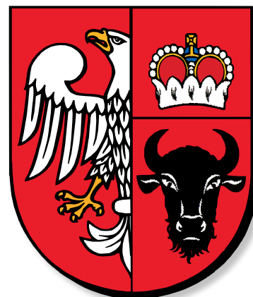
Herb Powiatu Zambrowskiego

W dniu 26 maja 2000 roku uchwałą Rady Powiatu w Zambrowie ustanowiono herb i flagę powiatu. Przyjęta symbolika podkreśla historyczną przynależność Powiatu Zambrowskiego do Mazowsza. Na tarczy trójdzielnej w polu prawym czerwonym półorzeł biały, w polu lewym czerwonym dwudzielnym mitra książęca, pod którą widnieje głowa żubra czarna. Natomiast w polu lewym nad godłem Zambrowa umieszczono mitrę symbolizującą dawną własność książęcą (założenie miasta).