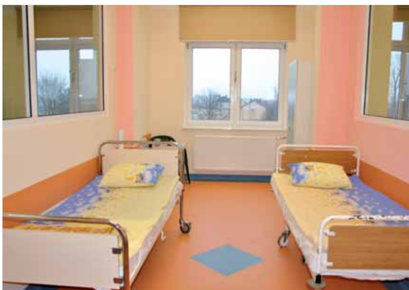
Oddział Dziecięcy w Szpitalu Powiatowym w Zambrowie