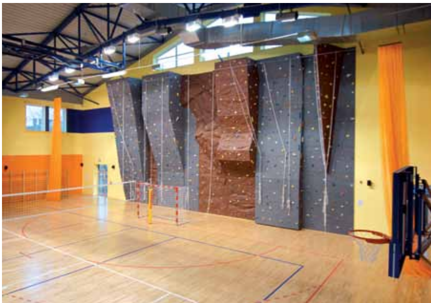
Ścianka wspinaczkowa w Sali Sportowej przy Zespole Szkół Nr 1 w Zambrowie