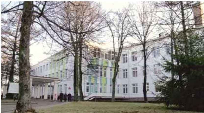
Szpital Powiatowy w Zambrowie