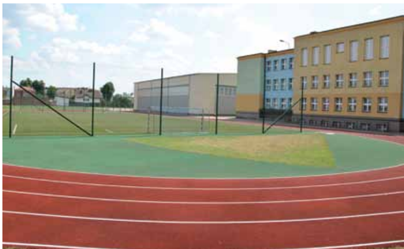
Boisko przy Zespole Szkół Ogólnokształcących w Zambrowie

Łącznie w latach 1999–2013 Powiat Zambrowski przeznaczył na zadania inwestycyjne związane z edukacją publiczną ponad 18 mln zł.