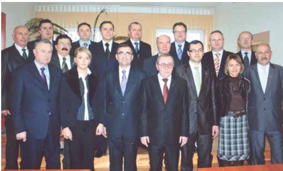
Rada Powiatu Zambrowskiego IV kadencji 2010–2014