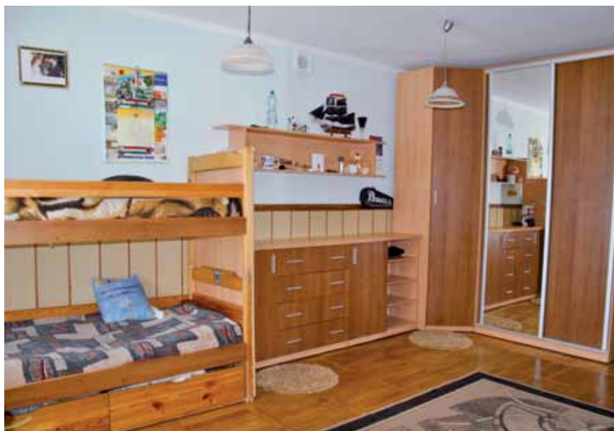
Pokój dla młodzieży – Centrum Obsługi Placówek Opiekuńczo-Wychowawczych

Warsztat Terapii Zajęciowej w Szumowie, utworzony i prowadzony przez Zgromadzenie Sióstr Służek NMPN Prowincja Łódzka od 1 grudnia 2006 r., zapewnia 35. osobom niepełnosprawnym, niezdolnym do podjęcia pracy zawodowej, możliwość udziału w rehabilitacji zawodowej i społecznej przez terapię zajęciową, zmierzającą do ogólnego rozwoju i poprawy sprawności każdego uczestnika.