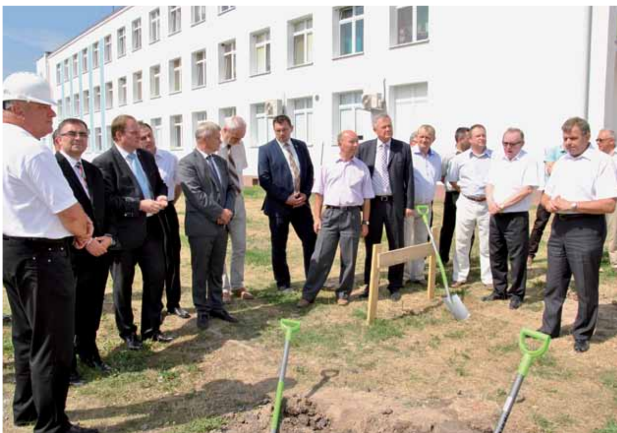
Rozpoczęcie budowy bloku operacyjnego oraz oddziału anestezjologii i intensywnej terapii Szpitala Powiatowego w Zambrowie