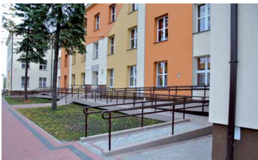
Termomodernizacja oraz zagospodarowanie terenu wokół Bursy Szkolnej nr 1 w Zambrowie