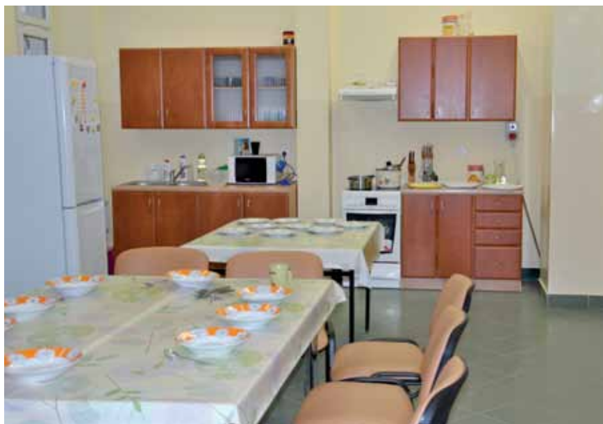
Pracownia gospodarstwa domowego – Powiatowy Ośrodek Wsparcia w Zambrówie