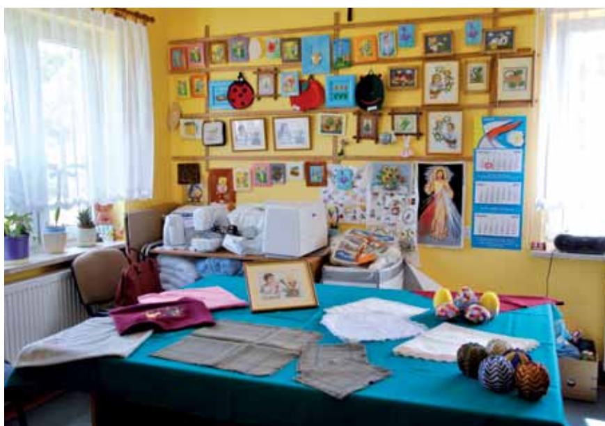
Pracownia krawiecka – Warsztaty Terapii Zajęciowej w Szumowie

Powiat prowadzi również Powiatowy Ośrodek Wsparcia w Zambrowie, jako zadanie z zakresu administracji rządowej, który zapewnia integrację społeczną dla ponad 20 uczestników z zaburzeniami psychicznymi (np. w roku 2013 było 24 uczestników).