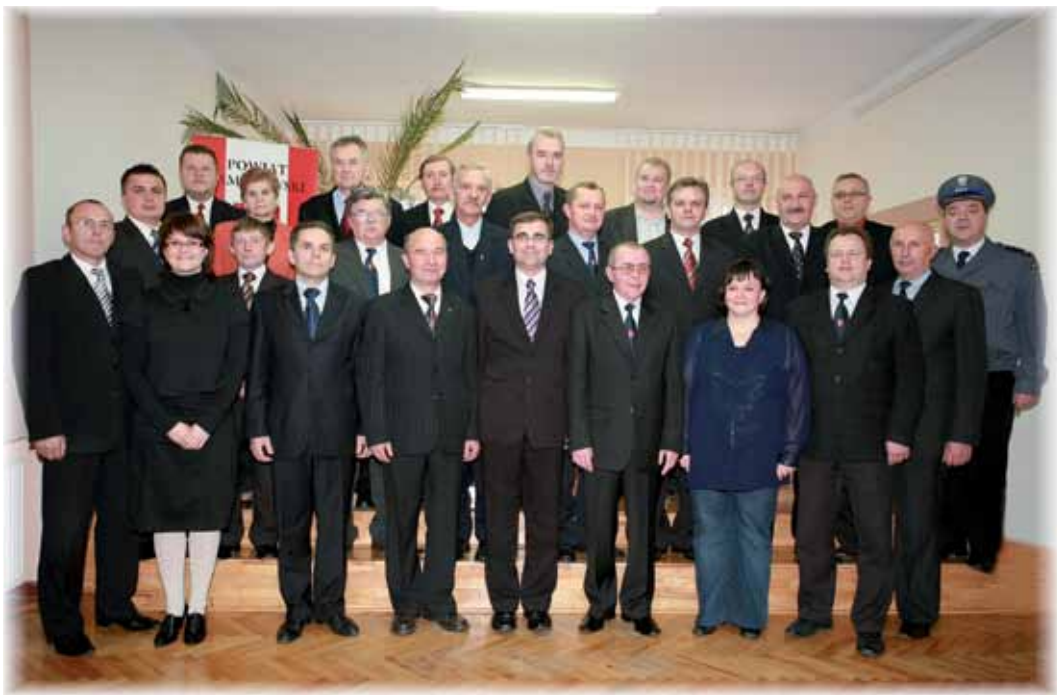
Rada Powiatu Zambrowskiego III kadencji 2006–2010