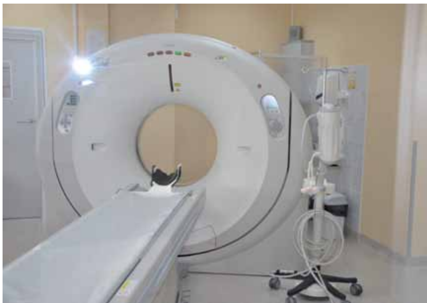
Tomograf w Szpitalu Powiatowym w Zambrowie