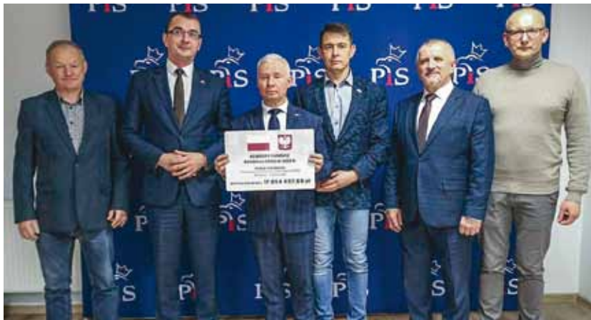
Przewodniczący Rady Powiatu i Członkowie Zarządu Powiatu otrzymali symboliczny czek na realizację kolejnych inwestycji.

- Gminy z naszego powiatu po raz kolejny otrzymały rządowe wsparcie na realizację inwestycji drogowych. Gmina Wilkołaz otrzymała łącznie 2 373 233,68 zł na dwie inwestycje drogowe; Gmina Anapol otrzymała 846 157,76 zł na przebudowę ul. Świeciechowskiej; Gmina Zakrzówek 525 029,94 zł na prze-