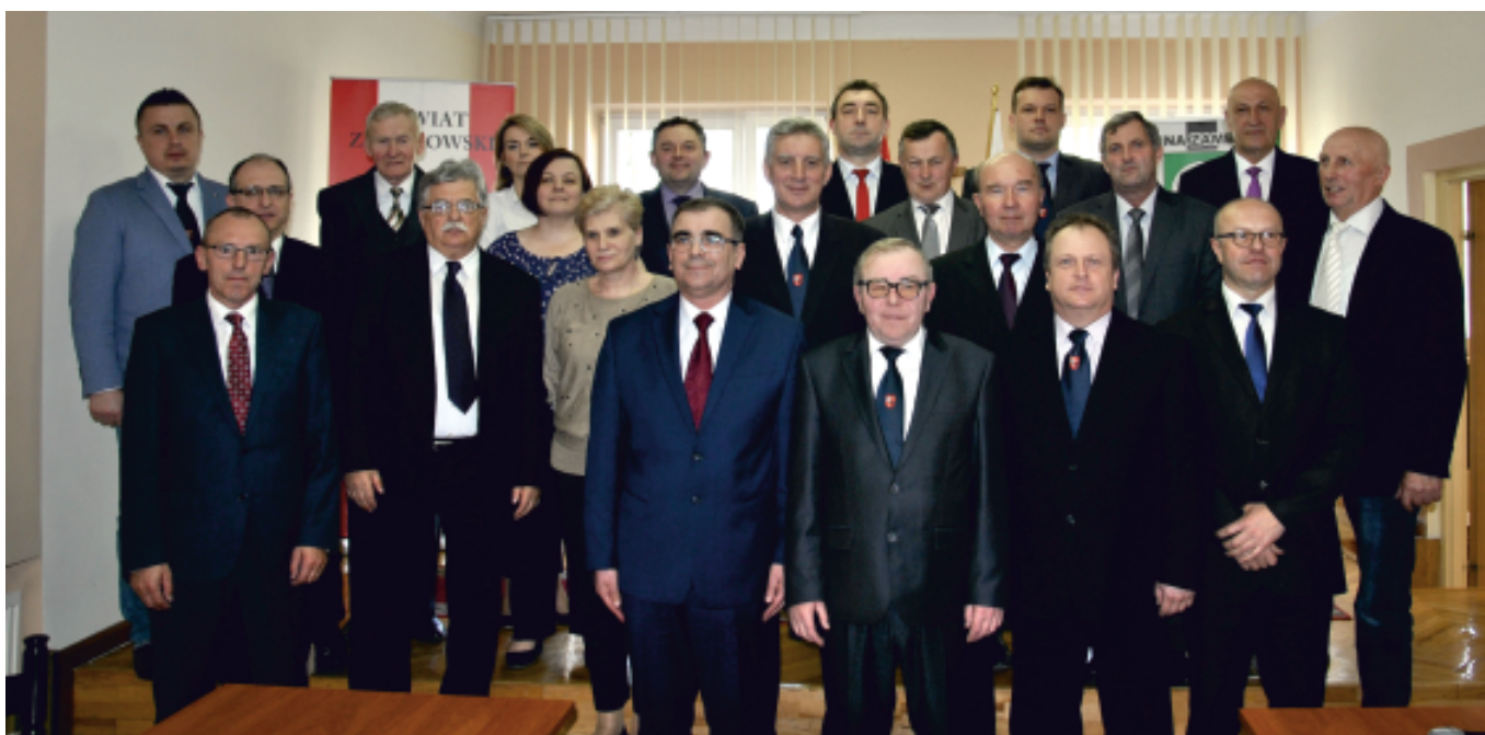
Rada Powiatu Zambrowskiego 2014-2018