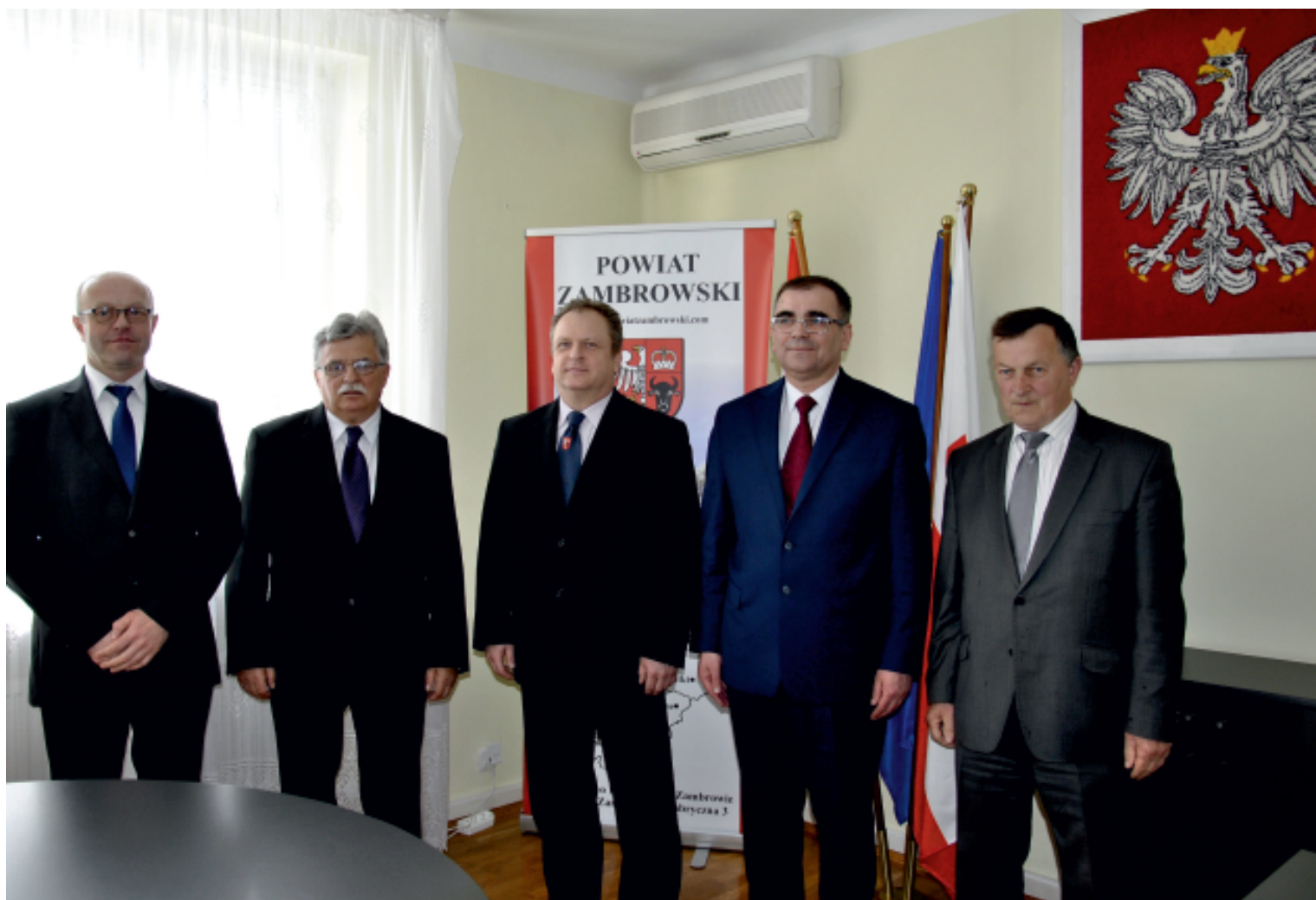
Zarząd Powiatu Zambrowskiego 2014-2018

i dróg publicznych, kultura oraz ochrona zabytków, kultura fizyczna i turystyka, geodezja, kartografia, administracja architektoniczno-budowlana, gospodarka wodna, ochrona środowiska i przyrody, rolnictwo, leśnictwo i rybactwo śródlądowe, porządek publiczny i bezpieczeństwo obywateli, ochrona przeciwpowodziowa, zapobieganie innym nadzwyczajnym zagrożeniom życia i zdrowia ludzi oraz środowiska, przeciwdziałanie bezrobociu oraz aktywizacja lokalnego rynku pracy, ochrona praw konsumenta, utrzymanie powiatowych obiektów i urządzeń użyteczności publicznej, obiektów administracyjnych, obronności, promocji oraz współpracy z organizacjami pozarządowymi.