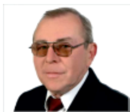
Przewodniczący Rady Powiatu Zambrowskiego

W naszej gazecie będziemy Państwa informowali o najważniejszych inwestycjach Powiatu Zambrowskiego oraz różnych innych działaniach naszego samorządu, o placówkach nam podległych, a także o wydarzeniach kulturalnych i sportowych.