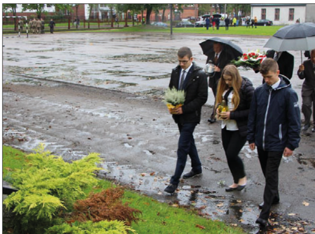
Delegacje składają kwiaty pod Dębami Pamięci