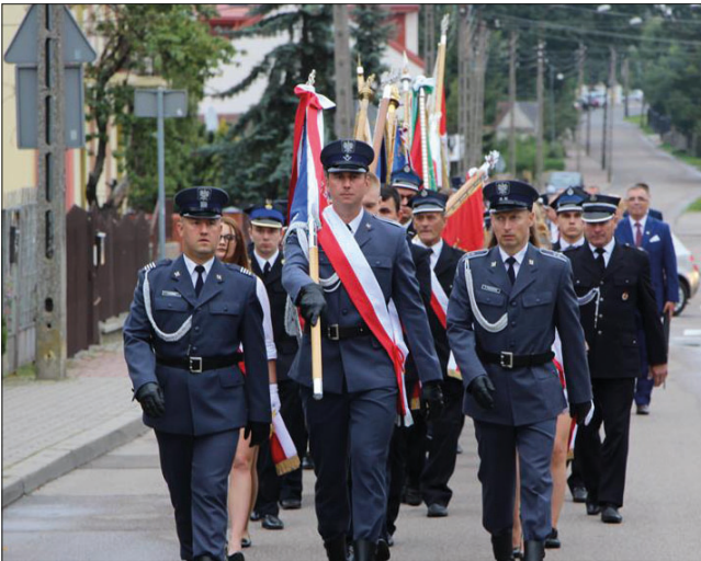
Przemarsz z kościoła pw. Trójcy Przenajświętszej na cmentarz parafialny w Zambrowie