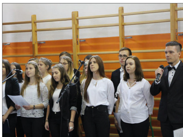
Młodzież ZSA w trakcie prezentacji patriotycznego montażu słowno - muzycznego