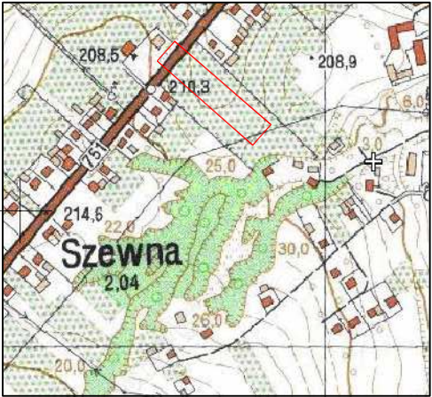
Granice nieruchomości przyjęto z EGiB.

woj.świętokrzyskie pow.ostrowiecki gm.Bodzechów ID.260703_2.0023 7.144.24.11.4.2 7.144.24.11.4.4 Skala 1:500