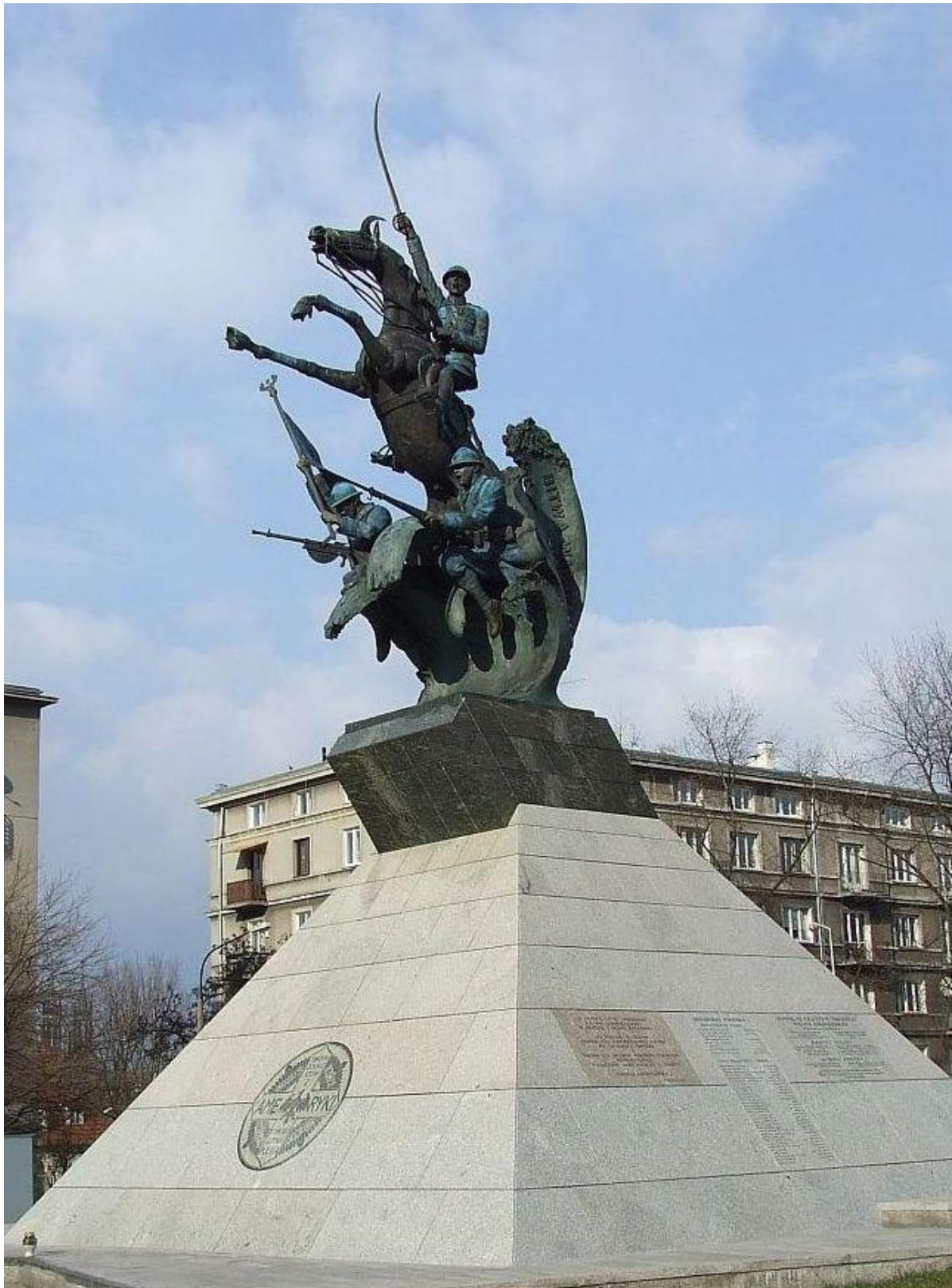
Pomnik Armii Błękitnej w Warszawie - dar Polonii Amerykańskiej dla Polski